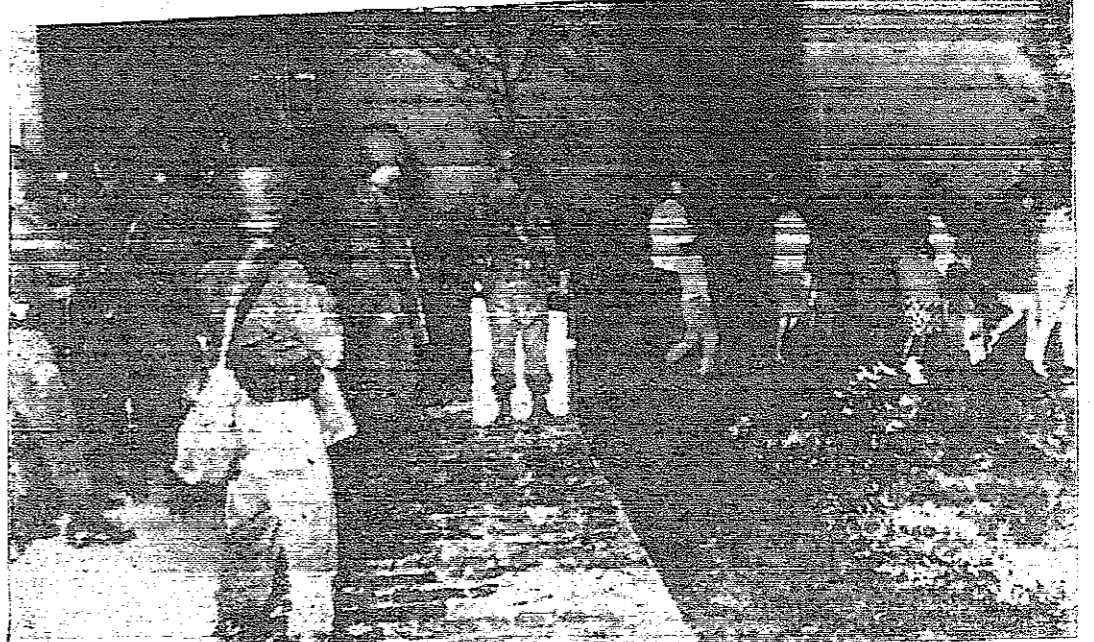
القوات العسكرية تبعد سكان البيوت المجاورة للقصر الجمهوري، وقسمان يان من القصر ان النار اطلقت على جنود الحرس فروموا على النار باطل